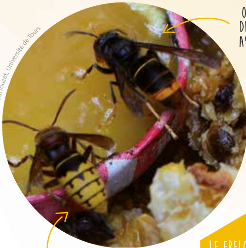
OUVRIÈRE DE FRELON EUROPÉEN