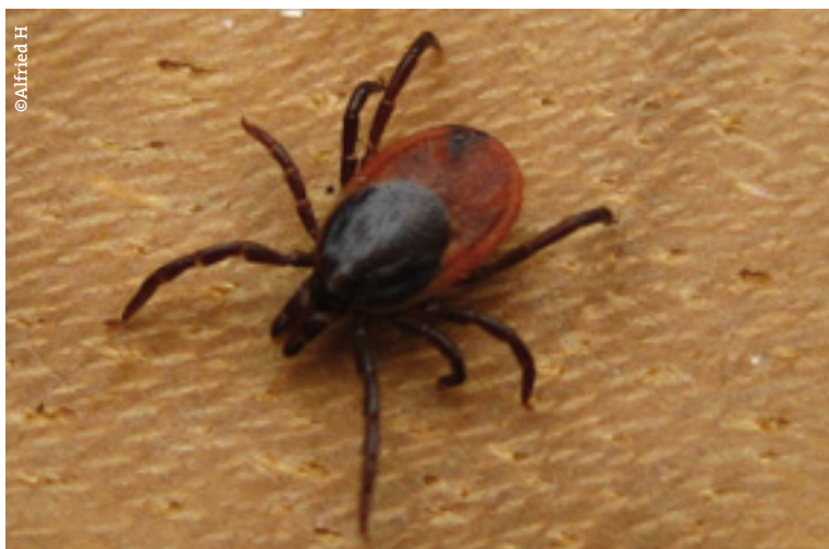
Tique femelle de 4 mm environ

tique sont vectrices, ce délai de transmission peut être encore plus long. En Europe, la transmission de B. afzelii pourrait, par contre, être un peu plus rapide que celle de B. bugdoferi sensu stricto [12].