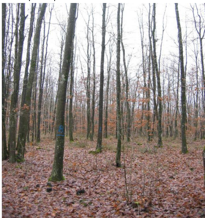
Expérimentation d'éclaircie de taillis de chêne

A ce jour, plus de 300 parcelles forestières font l'objet d'un suivi de placettes (une placette est un ensemble d'arbres repérés de manière durable sur le terrain).