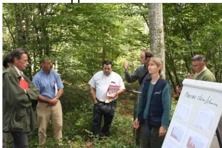
Des placettes servant à la formation des propriétaires, mais aussi des professionnels