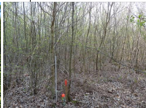
Evolution d'une régénération naturelle de chêne (photos prises au même endroit en 2000, 2005 et 2010)