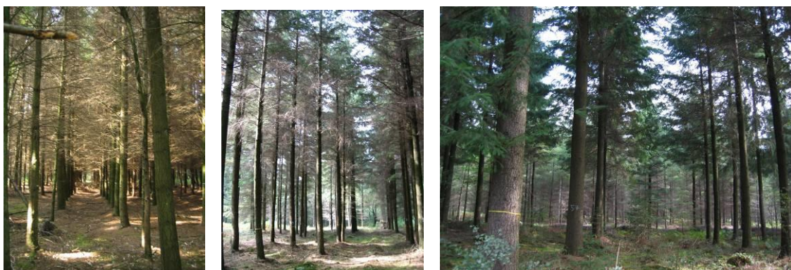
Expérimentation de comparaison d'éclaircie sur douglas, 10 ans après la coupe. 3 placettes, de gauche à droite : 1) témoin sans intervention, 2) : éclaircie à 800 tiges/ha, 3) éclaircie à 500 tiges/ha.

Une seule placette sur un site permet de suivre la croissance d'un peuplement en un climat et un sol donné (= référence), plusieurs placettes permettent de comparer différentes techniques (= expérimentation).