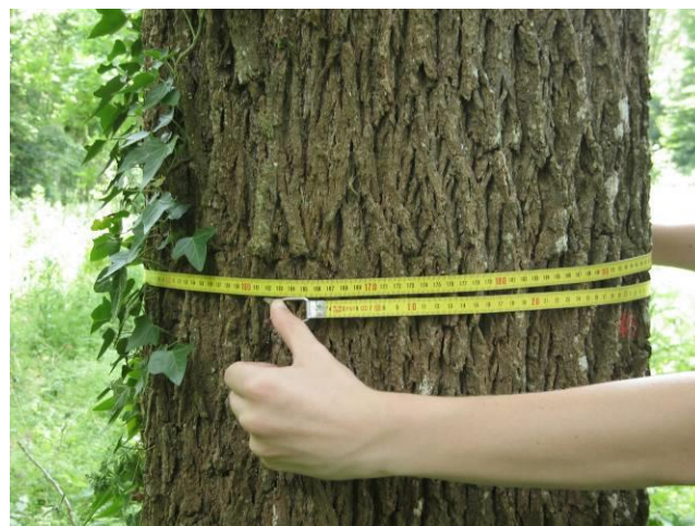
Mesure de la circonférence d'un Noyer noir

A ce jour, plus de 300 parcelles forestières font l'objet d'un suivi de placettes (une placette est un ensemble d'arbres repérés de manière durable sur le terrain).