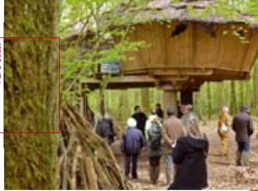
Les membres de PEFC Ouest ont découvert à Bois Landry une communication exemplaire sur la gestion durable de la forêt.