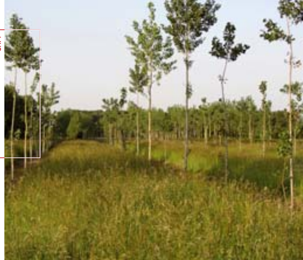
La charte Merci le peuplier participe financièrement au renouvellement des peupleraies.