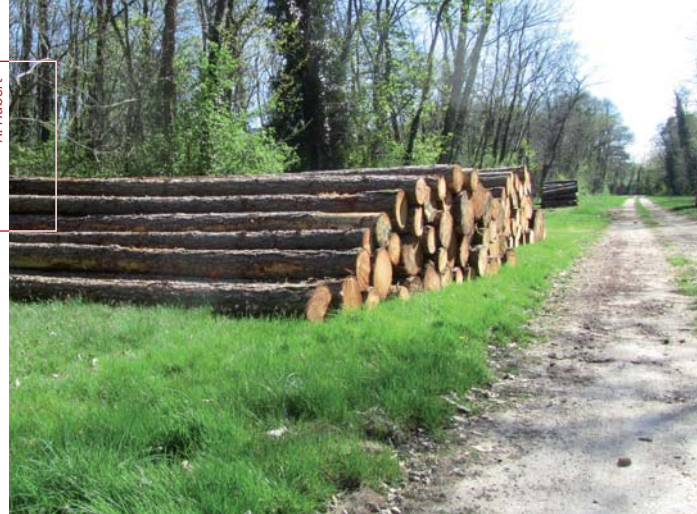
L'élargissement des chemins facilite la vente des bois et leur stockage.