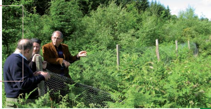
La visite conseil permet d'aborder tous les sujets forestiers.