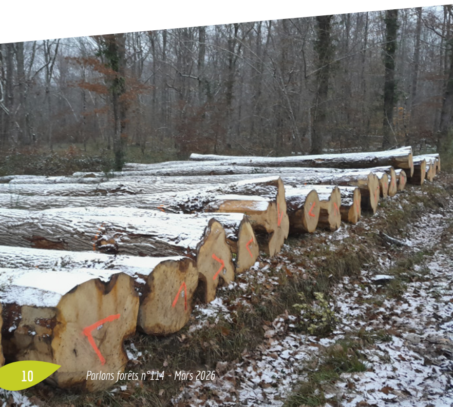
David Houmeau ©CNPF

D'après une consultation des gestionnaires, experts forestiers et coopératives de nos régions.