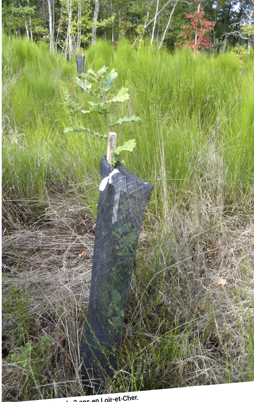
Plantation de chêne de 3 ans en Loir-et-Cher.

Dans notre étude, seules les plantations classiques ont été étudiées. Mais de plus en plus de forestiers diversifient les techniques et itinéraires : plantation en trouées ou en enrichissement, travail du sol en bandes ou en placeaux pour maintenir le maximum de recru, diminution des surfaces unitaires de