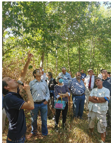
Léa Boubet © CNPF

Réunion gratuite organisée par la délégation régionale Île-de-France Centre-Val de Loire du Centre National de la Propriété Forestière et le GEDEF Loiret-Sologne.