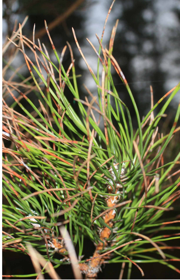
La maladie des bandes rouges, récurrente chez le Pin Laricio de Corse

Espèce présente sur certaines stations sableuses. Les larves de hannetons passent 2 à 3 ans enfouies dans le sol et consomment les racines des plants. Dans le cadre d'une plantation trop « propre », les dégâts sur les racines peuvent être impressionnants et la réussite de la plantation compromise. Favoriser la venue du recrû dans les reboisements pour diluer les dégâts liés à la consommation.