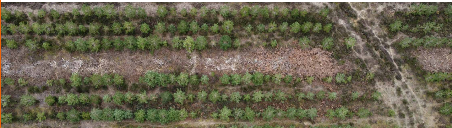
Plantation peu dense avec ses cloisonnements d'exploitation, Michel Chartier © CNPF

Éviter les sols trop argileux, compacts, hydromorphes et carbonatés. Ces sols accueilleront plutôt le pin Laricio de Calabre. Lorsque ces exigences sont respectées, le Pin laricio de Corse peut valoriser des sols relativement pauvres en assurant une production importante (8 à 20 m 3 /ha/an à 60 ans). Sur les sols riches, préférer les essences feuillues permettant une meilleure mise en valeur.