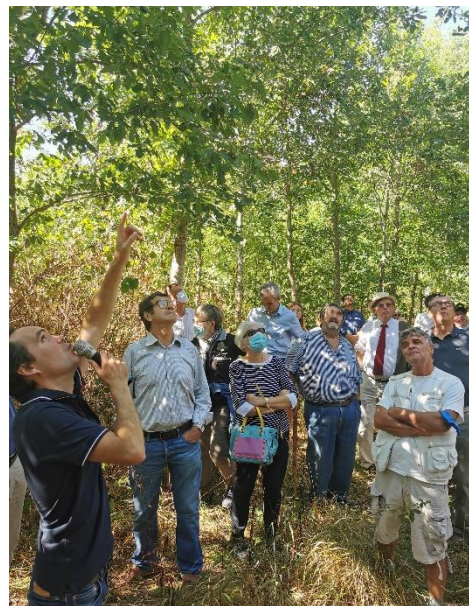
Léa Boubet © CNPF