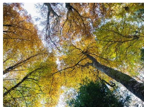
Etienne Beraud © CNPF