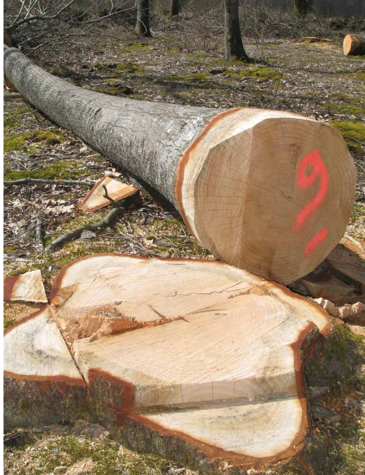
Grume de qualité de chêne rouge, Fanny Piers © CNPF

Pour tirer le meilleur parti du chêne rouge, le sylviculteur veillera à l'introduire sur un sol non calcaire, sain et prospectable, même sableux et pauvre et à suivre une sylviculture dynamique.