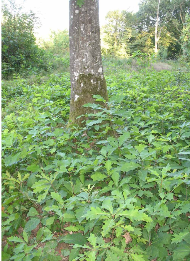
Régénération naturelle abondante du chêne rouge

Des éclaircies successives au profit des arbres d'avenir devront permettre d'atteindre cette densité finale dès 50 ans. La coupe de récolte pourra alors être réalisée entre 60 et 80 ans.