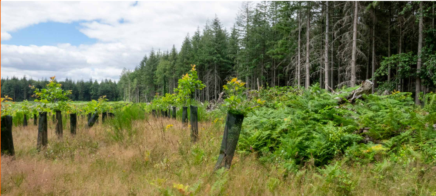
Plants de chêne rouge de qualités et bien équilibrés, Philippe Van Lerberghe © CNPF

Feuillu à croissance rapide et rustique, sauf quelques contraintes spécifiques